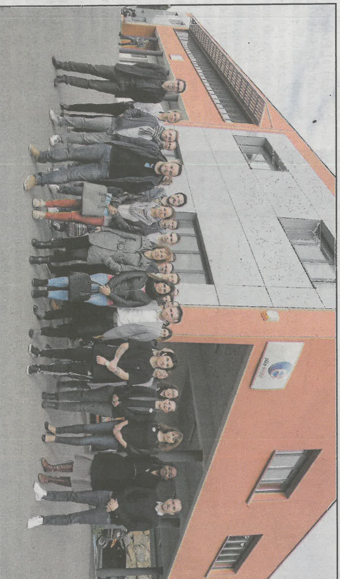
Les futurs employés ont le sourire. Ils ont tous signé un CDI à temps plein, la fin pour certains d'une longue période d'incertitude.

■ Profils « Je recherche un ADN, c'est-à-